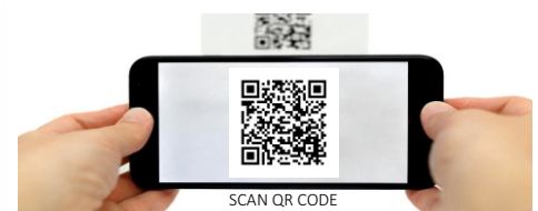
SCAN QR CODE

SIGA-NOS NO FACEBOOK acompanhe todas as novidades